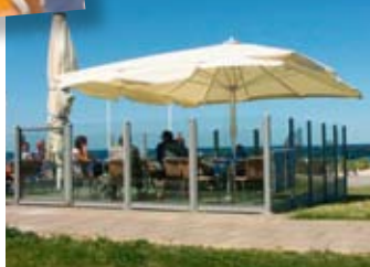
Deichterrassen am Strand

Lange Sandstrände vor dem Landschaftsdeich prägen den ca. 6 km langen Küstenabschnitt vom Ortsteil Kalifornien über Brasilien bis zum Schönberger Strand. Die Deichterrassen und die Fischerhütten am Schönberger Strand laden zum Verweilen ein, Strandkörbe (Mai bis September) bieten Entspannung.