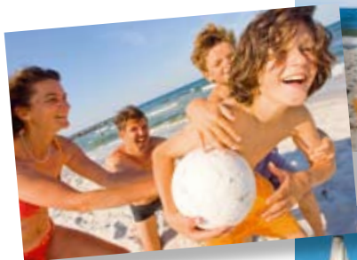
Entspannung am Strand

...in den Ortsteilen Ostseebad Kalifornien, Holm, Brasilien, Ostseebad Schönberger Strand und Neuschönberg.