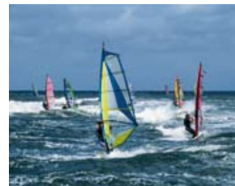
Surfen auf der Ostsee

Für einen abwechslungsreichen Aufenthalt sorgen die Wassersportschulen und das auch zum Skaten gut ausgebaut Radwegenetz mit dem Ostseeküsten-Radweg und den ausgeschilderten Themen-Routen. „Leinen los“ heißt es im Juli und August bei den Ausflugsfahrten von der Seebrücke am Schönberger Strand in die Kieler Bucht.