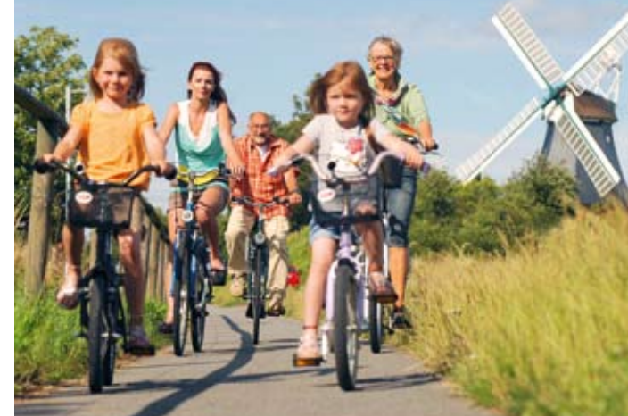
Radfahren auf der Natur-, Kultur- oder Maritim-Route