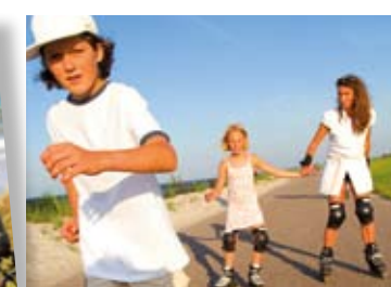
Skating auf dem Deich