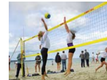
Beachpower am Strand