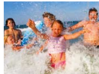
Badespaß mit der Familie

Für einen abwechslungsreichen Aufenthalt sorgen die Wassersportschulen und das auch zum Skaten gut ausgebaut Radwegenetz mit dem Ostseeküsten-Radweg und den ausgeschilderten Themen-Routen. „Leinen los“ heißt es im Juli und August bei den Ausflugsfahrten von der Seebrücke am Schönberger Strand in die Kieler Bucht.