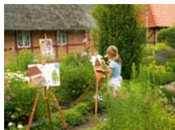
Probstei Museum Schönberg