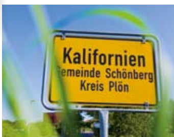
Ein Katzensprung von Kalifornien...